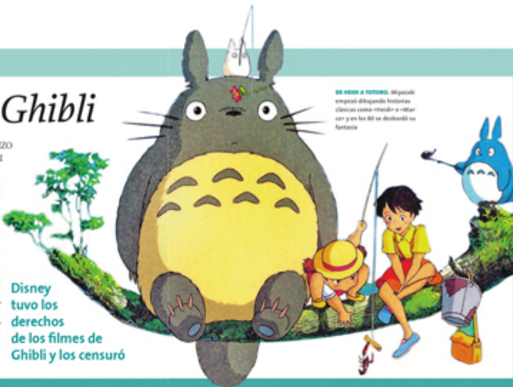
DE HEIDI A TOTORO. Miyazaki empezó dibujando historias clásicas como «Mario» y en los 80 se dedicó a fantasía